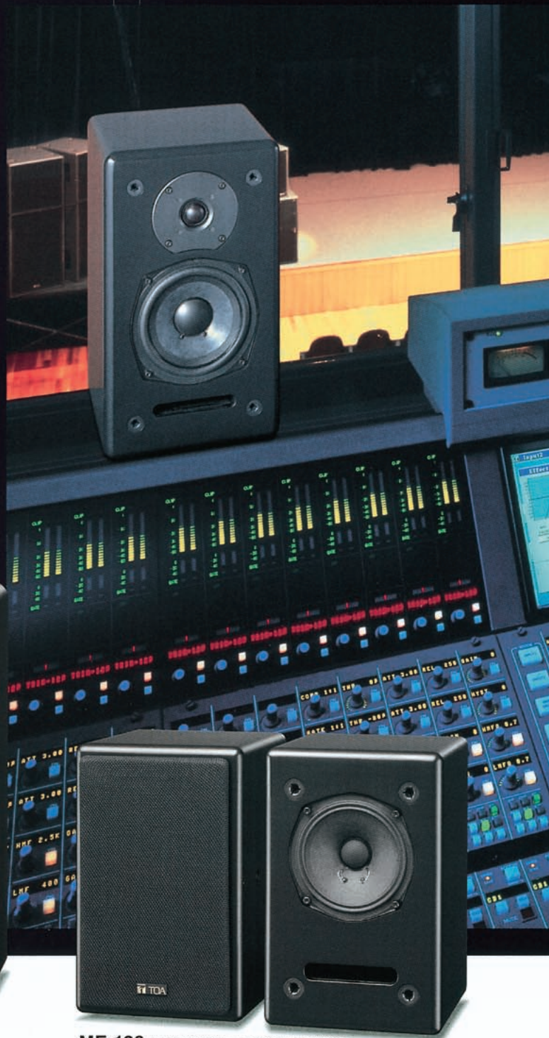
ME-120 *片方は前面ネットを取り外した状態です。 2本1組 希望小売価格 ¥51,450(税別 ¥49,000)