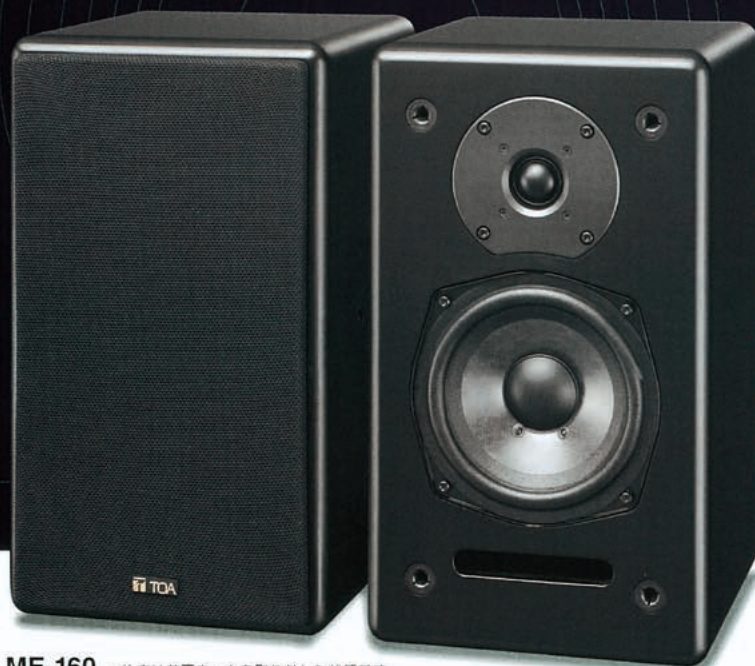
ME-160 *片方は前面ネットを取り外した状態です。 2本1組 希望小売価格 ¥105,000(税別 ¥100,000)