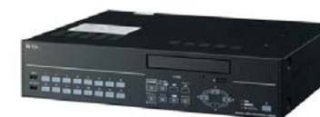
デジタルレコーダー C-DR161D6