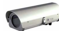
小型屋外カメラハウジング C-CH100