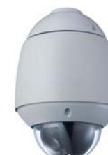
屋外用コンビネーションカメラ C-CC771