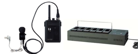
連絡用無線システム【携帯機】と 連絡用無線システム【充電器】

400MHz帯、送信出力10mWの特定小電力無線局のため、無線免許は不要。 事業所用PHSや他の店内連絡用無線システムと比較しても低価格。 携帯機は1回の充電で約20時間使用でき、長時間の営業でも安心です。